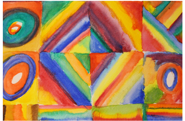
Beispiel aus einem Workshop

Nicht allein das Ergebnis ist von Bedeutung, ebenso der Prozess des Malens mit seiner belebenden Wirkung. Auch das Malen in der Gruppe das sich mit den anderen Teilnehmenden über die Bilder und das Malerlebnis selbst auszutauschen ist ein wesentlicher Bestandteil, um neue Zugänge zur eigenen Kreativität zu entwickeln.