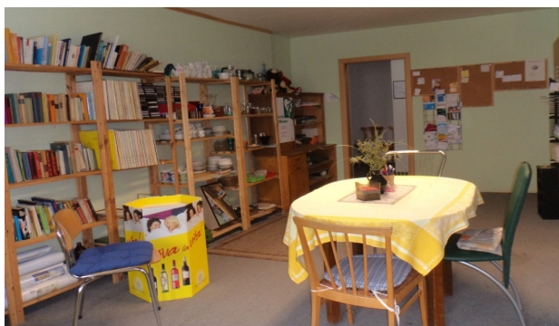
Umsonstladen Unterm Markt 2

Die Befragung wurde im November 2022 durchgeführt. Innerhalb eines Monats erhielten wir 113 ausgefüllte Fragebögen, wobei etwa die Hälfte der Befragten den ins Russische übersetzten Fragebogen nutzten. Nicht überraschend war bei der Auswertung: drei Viertel aller Gäste sind weiblich und mehr als die Hälfte wurde nicht in Deutschland geboren.